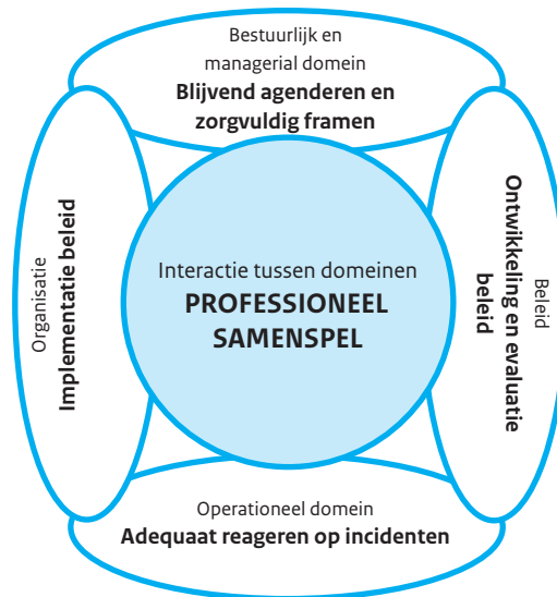
figuur 3: Actiekader

Het actiekader bestaat uit vijf actielijnen die volgens ons essentieel zijn voor bestuurders en managers. Zoals duidelijk zal worden in onderstaande uitwerking van de actielijnen, verschilt de invulling tussen bestuurders en managers.