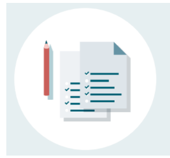
159 + 1224 vragenlijsten